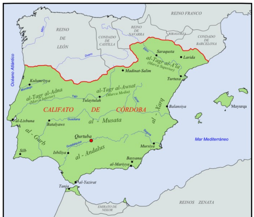
Península Ibérica durante el Califato de Córdoba